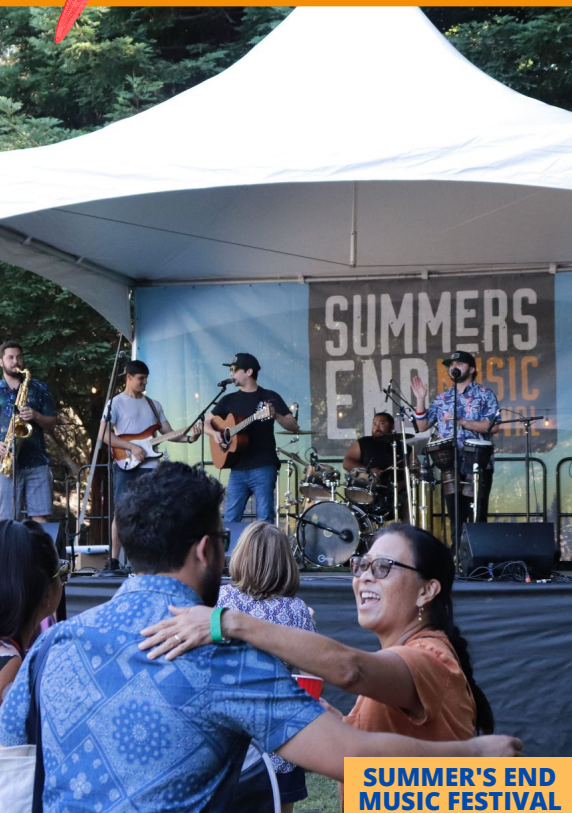
SUMMER'S END MUSIC FESTIVAL